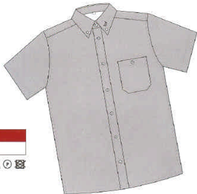
Tozo Chemise à manches courtes Matière principale 100% Coton