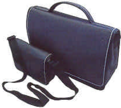
T340 Sacoche Matière principale 75% PVC, 25% Polyester