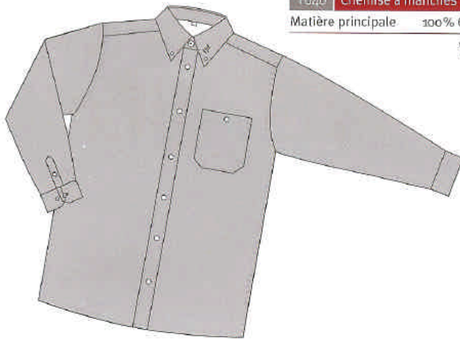
Tozo Chemise à manches longues Matière principale 100% Coton