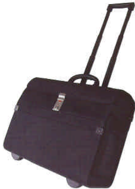
T350 Valise Trolley Matière principale Nylon